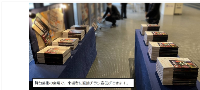
舞台芸術の会場で、来場者に直接チラシ宣伝ができます。