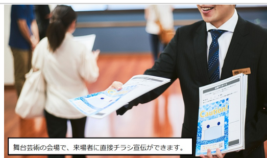
舞台芸術の会場で、来場者に直接チラシ宣伝ができます。