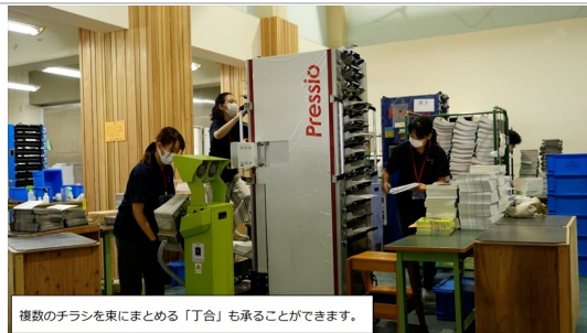
複数のチラシを束にまとめる「丁合」も承ることができます。