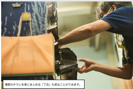
複数のチラシを束にまとめる「丁合」も承ることができます。